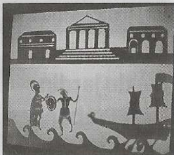
Les aventures en théâtre d'ombre d'Ulysse.